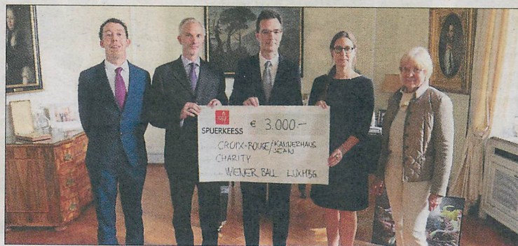
Die Organisatoren unterstützen das Rote Kreuz.

Erlös des „Wiener Ball“ 2015 für Rotes Kreuz